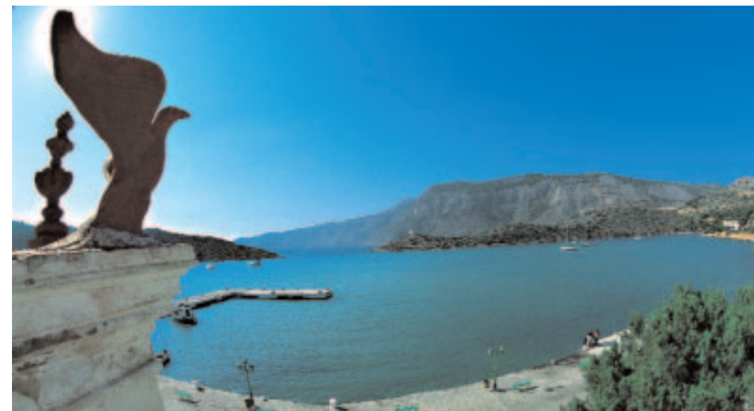
Rodi, vista su Mandraki dal forte di San Nicola. A sinistra: la baia di Panormitis, a Simi. Pagina a lato: ancoraggio a Thessalona, Simi