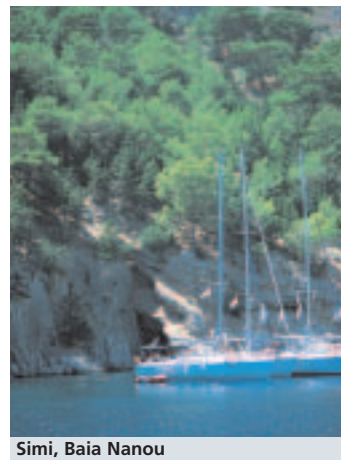
Simi, Baia Nanou