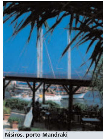
Nisiros, porto Mandraki