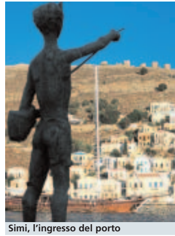
Simi, l'ingresso del porto