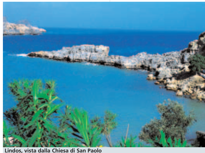
Lindos, vista dalla Chiesa di San Paolo