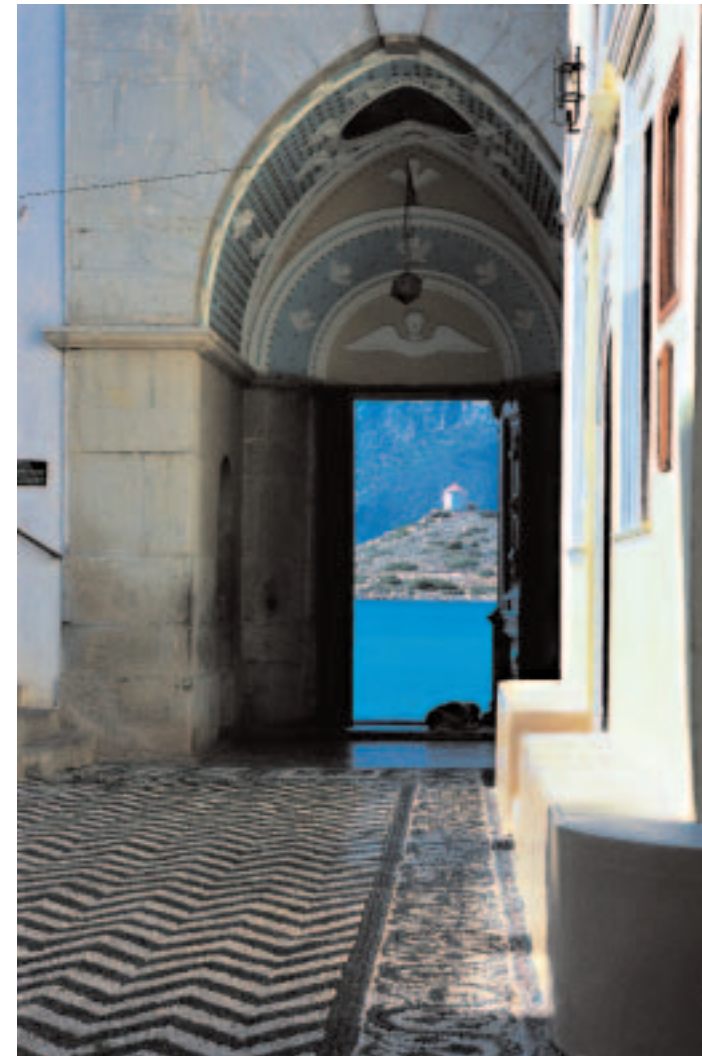
Uno scorcio del Monastero dell'Arcangelo Michele, a Panormitis di Simi

Dall'alto: Porto Palon a Nisiros, l'ancoraggio migliore dell'isola. L'imponente forte di San Nicola, a Rodi. Fumarore nel vulcano di Nisiros. Un pescatore nella Baia di Thessalona, sulla costa orientale di Simi